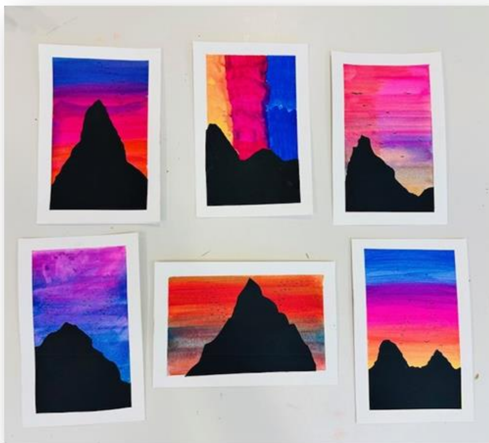
Lors d'un atelier aquarelle