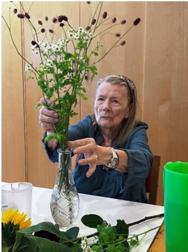
Lors d'un atelier floral