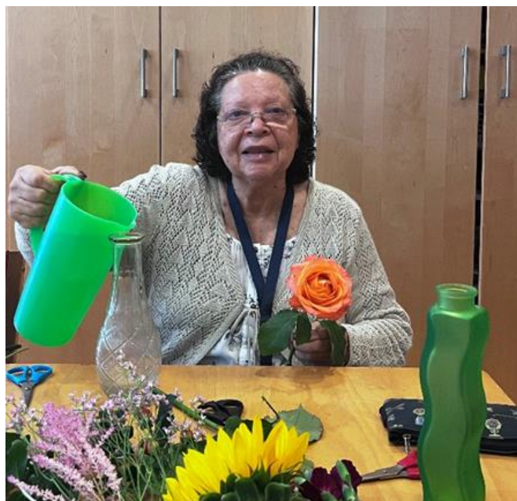
Occupée à remplir les vases